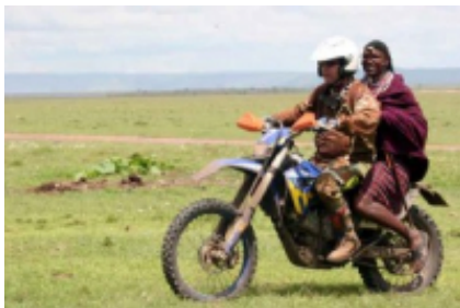
4 - Kericho - Maasai Mara National Reserve - 220 km