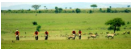
7 - Loyk Mara Camp - Maji Moto - 180 km