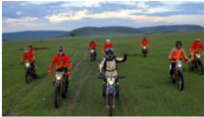
2 - Nairobi - Soysambu - 220 km