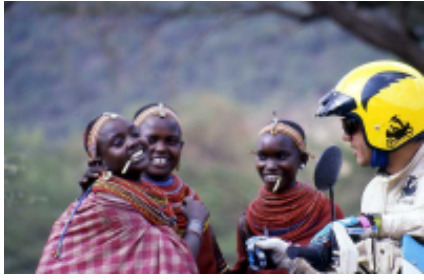
8 - Maji Moto - Nairobi - 140 km