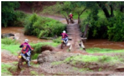
3 - Soysambu - Kericho - 200 km