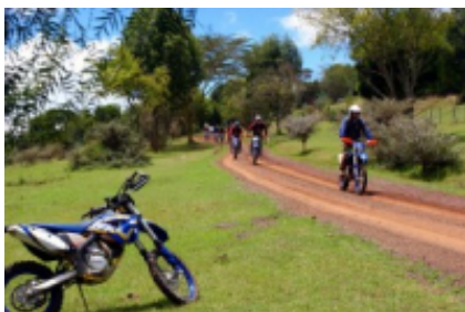
6 - Maasai Mara National Reserve - Loyk Mara Camp - 120 km