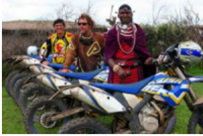
1 - Nairobi - Nairobi - 0 km