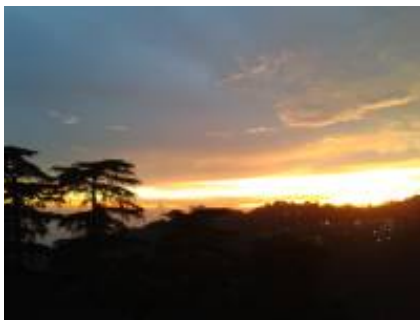
3 - Leh Ladakh - ལཱ་ཁཱ་ ལྷ་ཁྱེད་, Ladakh, India - Leh Ladakh - ལཱ་ཁཱ་ ལྷ་ཁྱེད་, Ladakh, India -