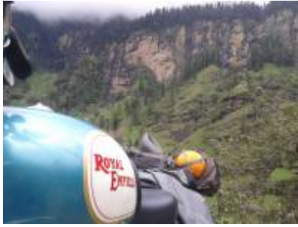
1 - - Delhi -