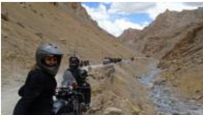
9 - Leh Ladakh - ལཱཱཱ་ ལཱཱཱཱ་, Ladakh, India - Delhi -