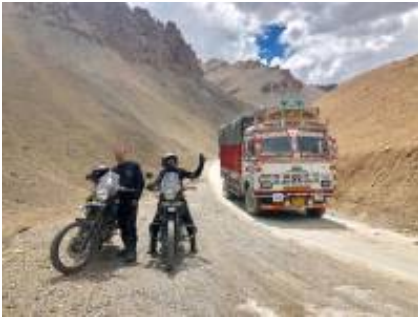
7 - Thiksey Monastery - Lamayuru -