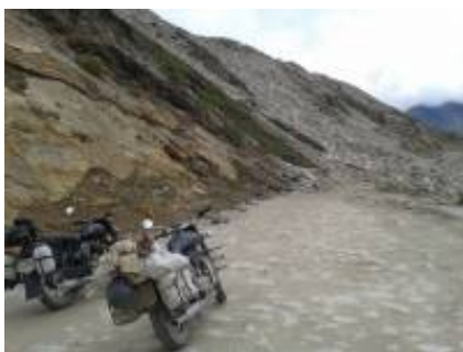
5 - Valle di Nubra - Valle di Nubra -