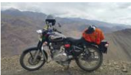
10 - Delhi - Delhi -