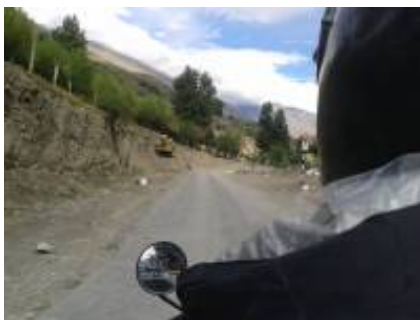
4 - Leh Ladakh - ལཱ་ཁཱ་ ལྷ་ཁྱེད་, Ladakh, India - Valle di Nubra -