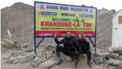
8 - Lamayuru - Leh Ladakh - ལཱཱཱ་ ལཱཱཱཱ་, Ladakh, India -