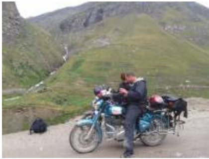
2 - Delhi - Leh Ladakh - ལཱ་ཁཱ་ ལྷ་ཁྱེད་, Ladakh, India -