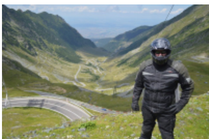
6 - Căpățânenii Pământenii - Râncea - 170 km