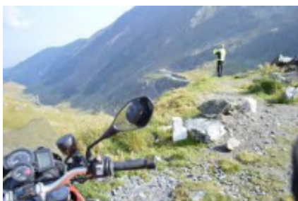
5 - Brașov - Căpățânenii Pământenii - 196 km