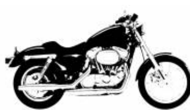
X Trainer 300 + $523.23