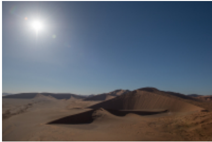
3 - Città del Capo - Tulbagh - 130 miles