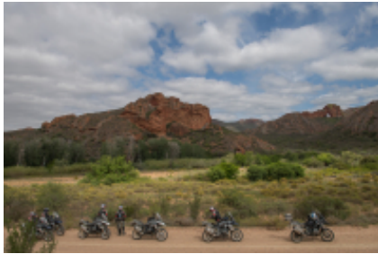
2 - Città del Capo - Cape Point - 90 miles