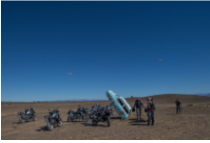
7 - Fish River Canyon - Springboks Stellenbosch - 190 miles