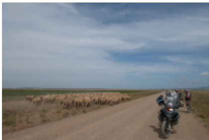
5 - Calvinia - Upington - 300 miles