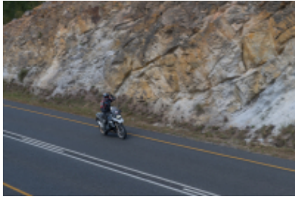
1 - - Città del Capo -