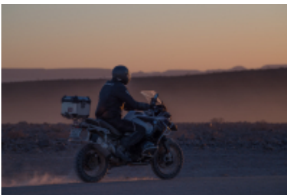
10 - Sossusvlei - Sossusvlei - 80 miles