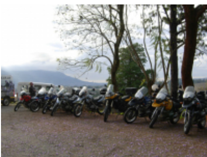
11 - Sossusvlei - Swakopmund - 240 miles