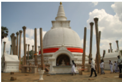
4 - Jaffna - Jaffna - 150