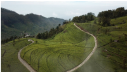
11 - Tissamaharama - Mirissa - 120