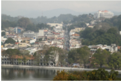
1 - - Colombo - 10