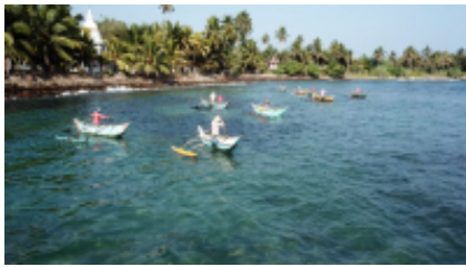
2 - Colombo - Anuradhapura - 175