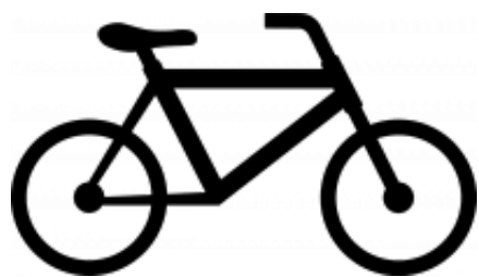
My own bicycle