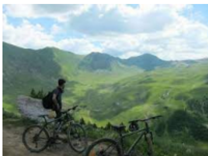
5 - Sotire - Bënjë - 66