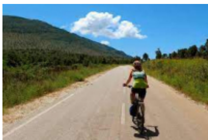
3 - Pogradec - Korçë - 51