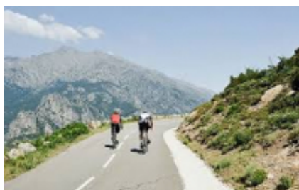
2 - Tirana - Pogradec - 29