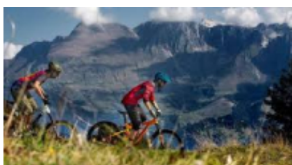
6 - Bënjë - Përmet - 0