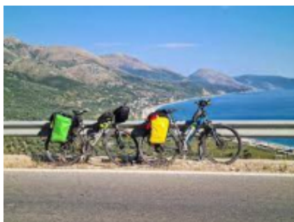
1 - Tirana - Tirana - 0