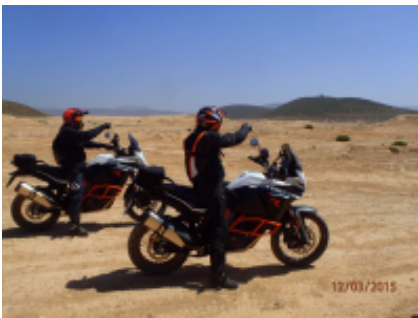
10 - - -