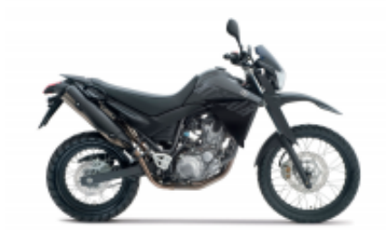
XT 660 R + $989.74