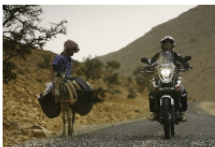
5 - Taouz - Boumalne Dades - 130 KM