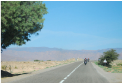
9 - Bni Sidel Louta - Ceuta - 329 KM