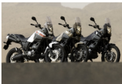
4 - - Taouz -