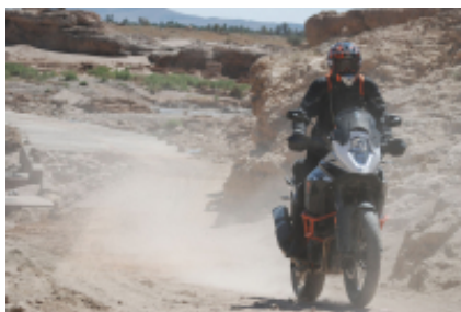
6 - - Tounfit -