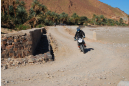
8 - Fes - Fes - 270 KM