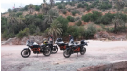
7 - Tounfit - Fes - 280 KM