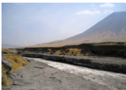
2 - Algeciras - Fes - 298 Km