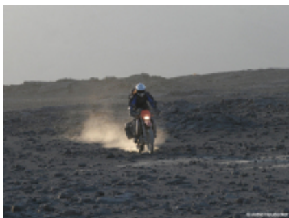
3 - Fes - Aarab Sebbah Ziz - 396 Km