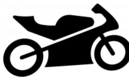
My own motorbike + $0.00