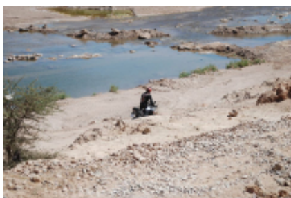
1 - - Algeciras -