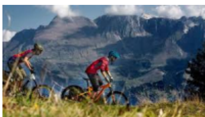
6 - Bënjë - Përmet - 0