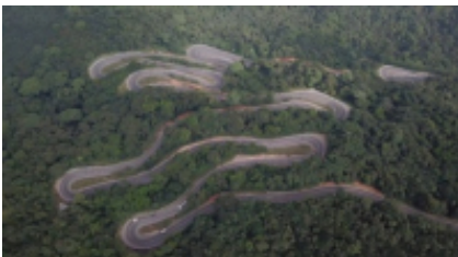
13 - Negombo - -