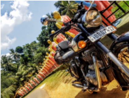
11 - Tissamaharama - Mirissa - 120