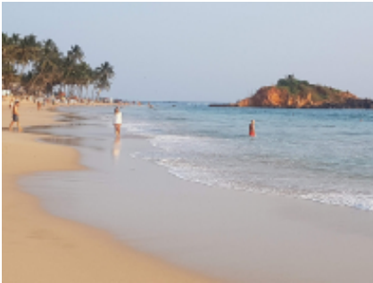
10 - Ella - Tissamaharama - 160