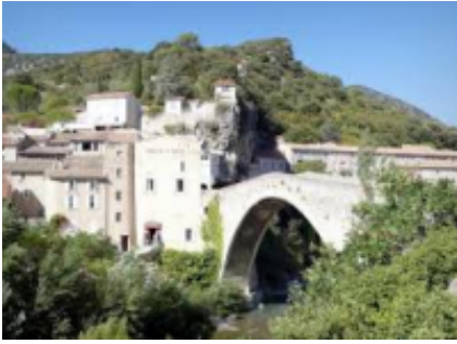
7 - Millau - Nyons -