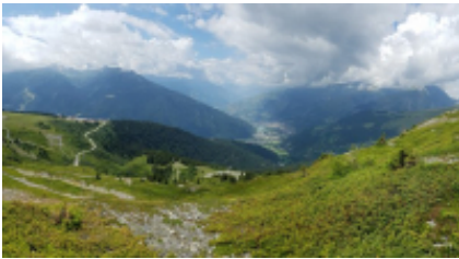
10 - La Clusaz - Bourg-Saint-Maurice -