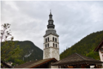
9 - Grenoble - La Clusaz -