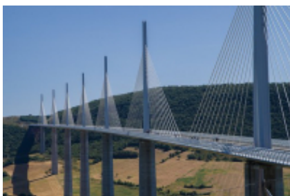
6 - Montauban - Millau -