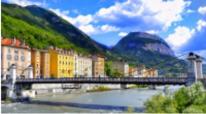
8 - Nyons - Grenoble -