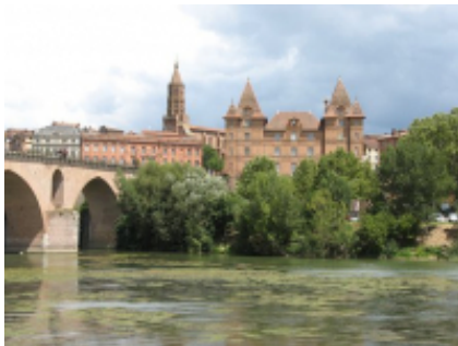
5 - Biarritz - Montauban -