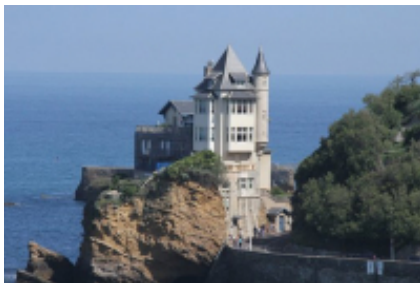
4 - Tarbes - Biarritz -