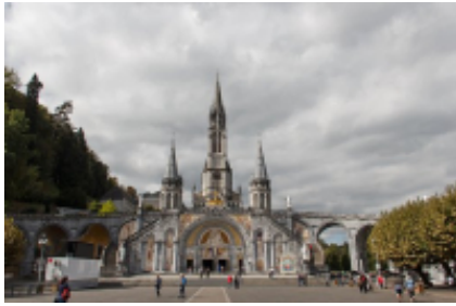
3 - Andorra la Vella - Tarbes -