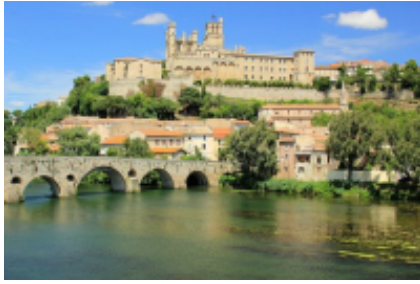
1 - Marseille - Montpellier -