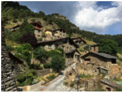
2 - Montpellier - Andorra la Vella -