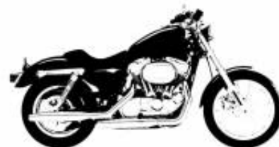
R 18 Transcontinental + $876.06