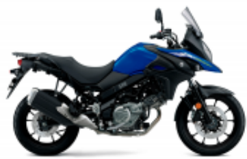
V-STROM 650 + $0.00