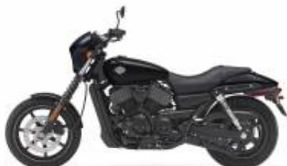
Street 750 + $0.00