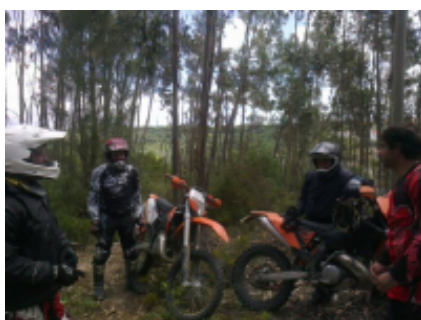
4 - Santarém - Santarém - 160 km