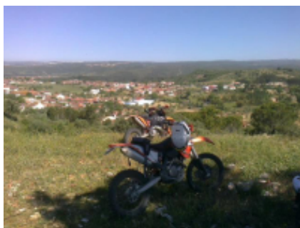
3 - Santarém - Santarém - 150 km