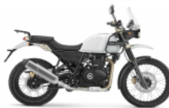
Himalayan 500 + $110.22