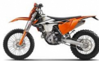
EXC 350 + $612.38