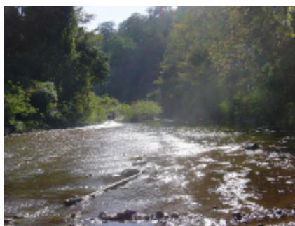
1 - - Nusa Dua -