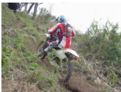
5 - Tabanan - Tabanan -