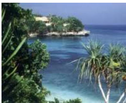
3 - Pekutatan - Negara -