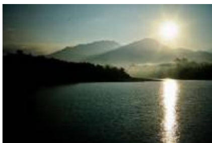
4 - Negara - Tabanan -