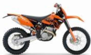
EXC 250 + $612.38