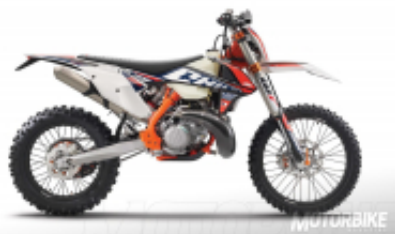
300 2T six days + $612.38