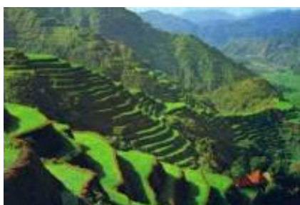
6 - - Kintamani -