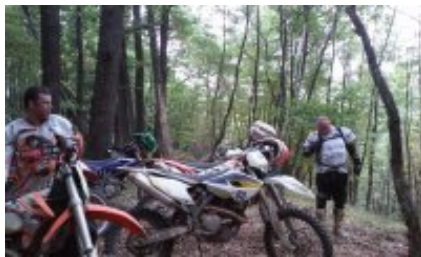
1 - - Sibiu -