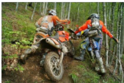
3 - Sibiu - Şugag - 8h