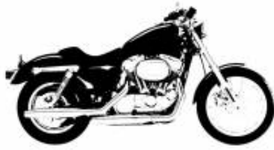
Road Glide GPS incl. Touring Class + $0.00