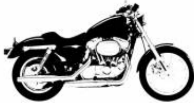
Heritage Softail Cruiser Touring Class + $0.00